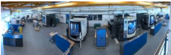
Panoramaansicht der Fertigung in Halblech (2018)