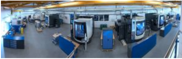
Panoramaansicht der Fertigung in Halblech (2018)